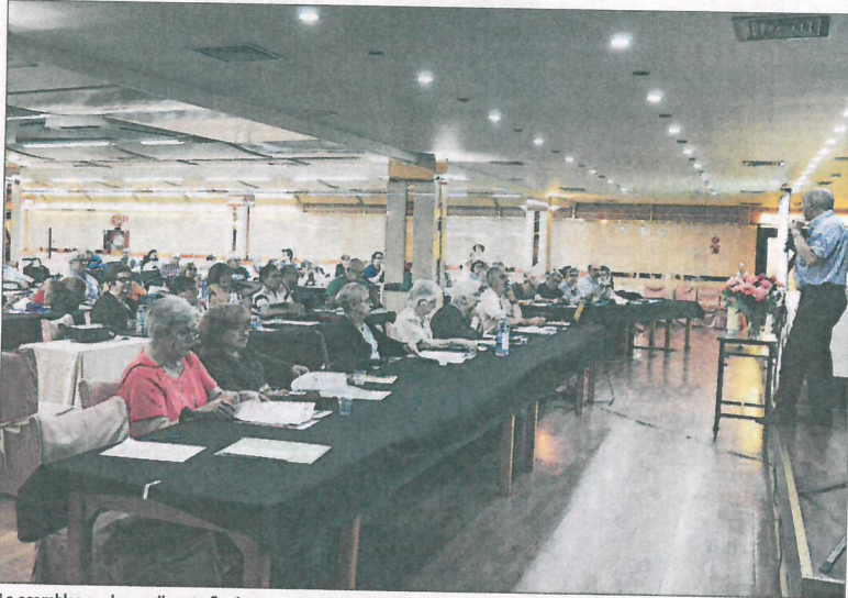
La asamblea se desarrolla este fin de semana en los salones del hotel Puerta de Segovia.

Así, Frater destaca que el fin primario de su organización es "acercarnos al Evangelio e interiorizarlo como soporte de vida, co-